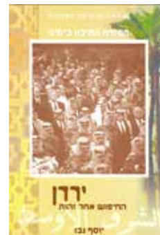
ירדן: החיפוש אחר זהות יוסף נבו הוצאת האוניברסיטה הפתוחה, 2005