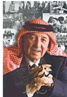
حساب السرايا وحساب القرايا (מה שרואים מאחורי המדגלים) נדי'ר ארשיד הוצאת אסאקי, 2006; הוצאת אסנאבל, 2009