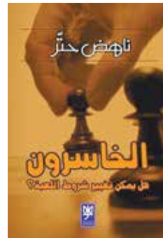
האסרונ - هل يمكن تغيير شروط اللعبة? (הלוזרים: האם אפשר לשנות את כללי המשחק?) נאהד חתר הוצאת ורד, 2006