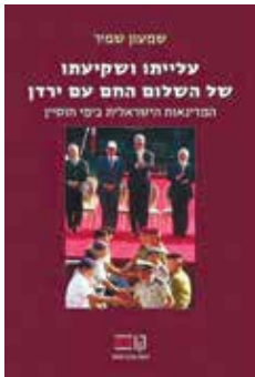
עלייתו ושקיעתו של השלום החם עם ירדן: המדינאות הישראליית בימי חוסיין שמעון שמיר הוצאת הקיבוץ המאוחד, 2012

איך התגלגלת דווקא למחקר על ירדן? זה היה שילוב של רקע מקצועי ומחקרי וסקרנות אישית עצומה. הסכם השלום הירדני-ישראלי, שבאחרונה מלאו 25 שנה לחתימתו, איפשר לי לעשות מחקר שדה בירדן, אבל היחסים בין המדינות עניינו אותי פחות מהיחסים בין המשטר המדינה והחברה בירדן עצמה. המורכבות של הסוגיות הפנימי-ירדניות ריתקה אותי. האוטוביוגרפיה של נדי'ר ארשיד היא דוגמה טובה למורכבות הזאת: ארשיד היה קצין צבא בכיר, סורר ואנטי-מלוכני שהפך לראש המוחאבראת – השירות החשאי (בירדן זה לא רק אפשרי אלא גם מקובל). ספרו התפרסם בזמן שכתבתי את הדוקטורט. השגתי אותו, אבל אז גיליתי שהיתה לו גרסה מוקדמת שצונזרה. בדרך לא דרך השגתי צילום שלה ובמשך שבועות השויתי בין הגרסאות. זה היה שיעור מעשי בהיסטוריה ובהיסטוריוגרפיה, אבל גם כפוליטיקה ירדנית בת-זמננו. גם הביוגרפיה של אבי שליים על המלך חוסיין, שתורגמה לעברית, שורת באופן עוצר נשימה את סיפורו של השליט עם סיפורה של המדינה ומציגה היבטים נוספים של המורכבות הירדנית. כמו במקרים אחרים, הסערה שהתעוררה בירדן עם פרסום הביוגרפיה הזאת מרתקת לא פחות מהביוגרפיה עצמה. האם יש תרחיש שבו ירדן תבטל את ההסכמים עם ישראל?